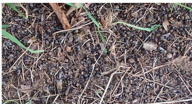
Abeilles mortes au pied des ruches