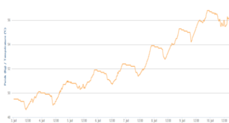
Sarrasin du 3 au 10 juillet

Cependant, ces constats de prise de poids ne sont pas partagés par tous. Les facteurs pédo-climatiques influent fortement sur les rendements.