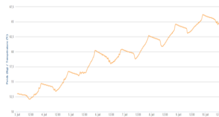
Phacélie du 3 au 10 juillet