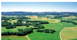
Haies et bosquets sur parcelles agricoles – Réglementations applicables

À ce titre, les haies et les bosquets sont protégés par plusieurs réglementations qui se combinent et qu'il est impératif de connaître avant d'envisager toute intervention, y compris l'entretien courant.